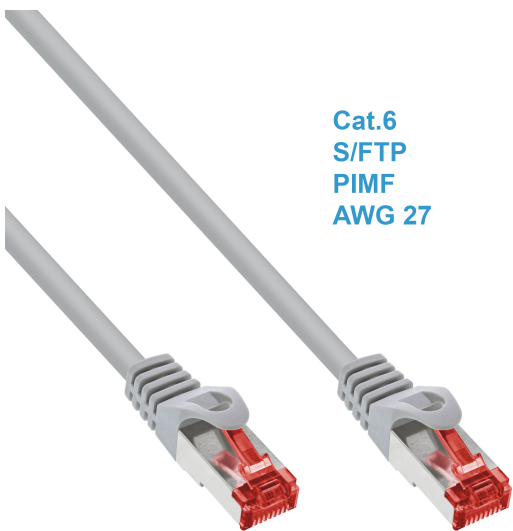
Cat.6 S/FTP PIMF AWG 27