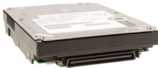
SCA 80 pins