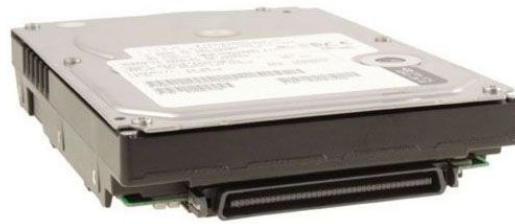
SCA 80 pins