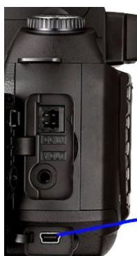
USB Mini B Port