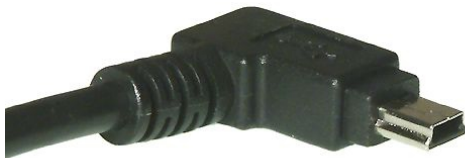
USB Mini B