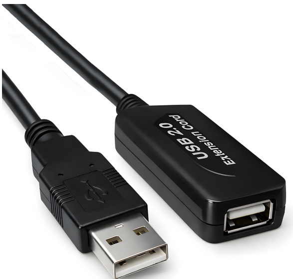
USB 2.0 A