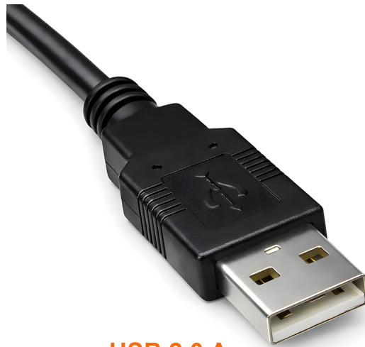
USB 2.0 A