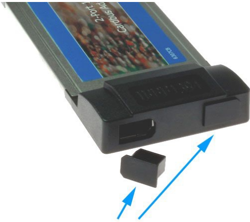
Kappe cap capuchon