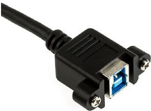
USB 3.0 B weiblich Buchse USB 3.0 B female USB 3.0 B femelle