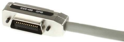
Centronics 24 = CEN 24