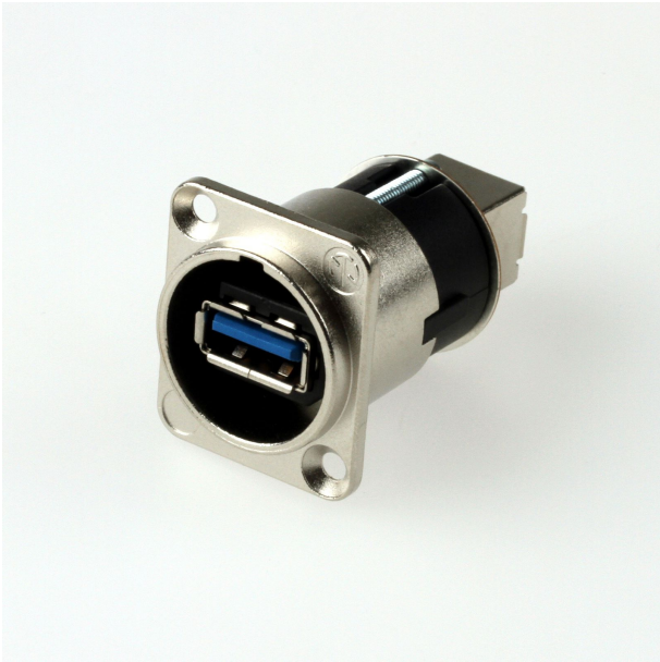
Frontplatten-Ausschnitt (von hinten)