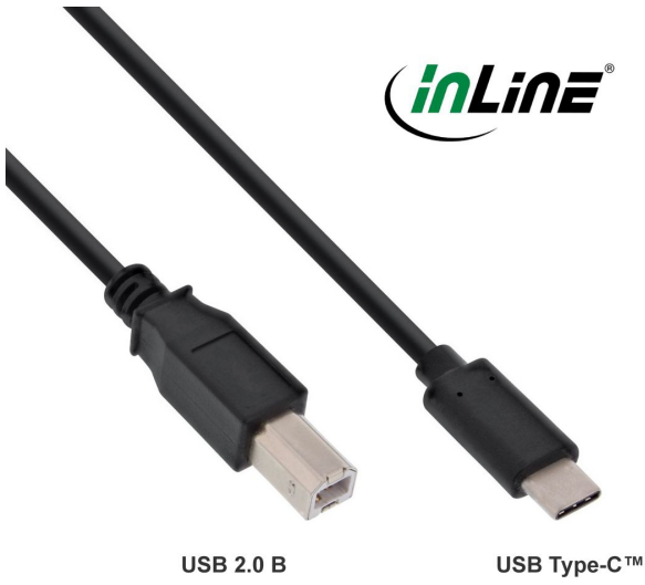
USB 2.0 B