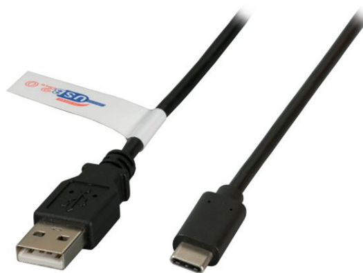
USB 2.0 A USB Type-C™ weiß white blanc