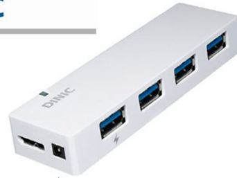
Buchse für Netzteil-Anschluss port for power supply port pour l'alimentation