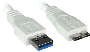
USB 3.0 A