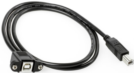
E238846 UL AWM 2725 80°C 30V VW-1