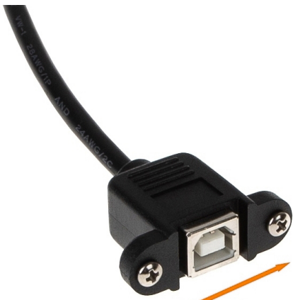
30mm Schraubenabstand screw distance distance entre les vis