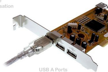
USB A Ports

Anwendungsbeispiel example of use exemple d'utilisation