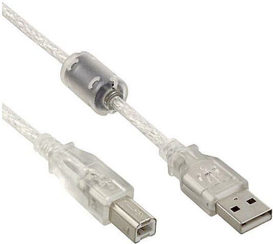
USB 2.0 B