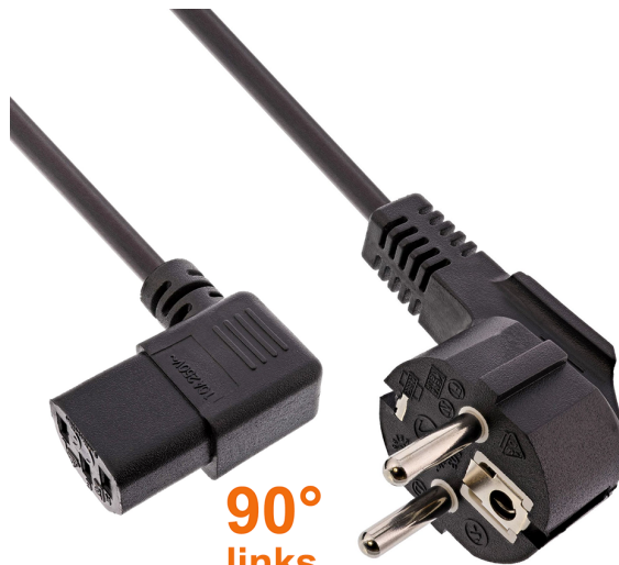
90° links left / à gauche